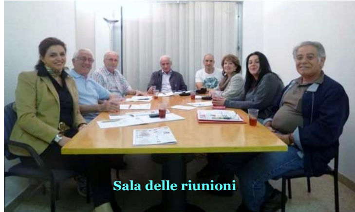
Sala delle riunioni

Tra le priorità della SAIG figura anche la coesione della comunità italiana ginevrina, per il cui conseguimento la Società non lesinerà sforzi convinta che non