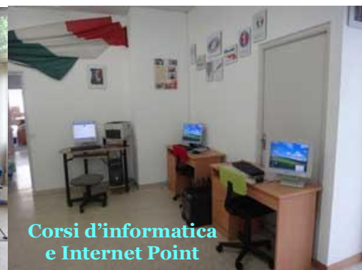
Corsi d'informatica e Internet Point