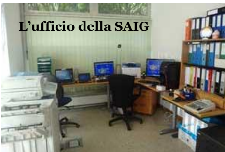
Dove si stampa La notizia di Ginevra