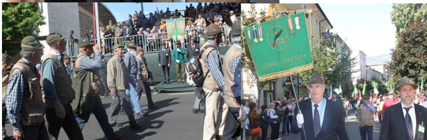
Il Gruppo di Ginevra saluta il Labaro nazionale