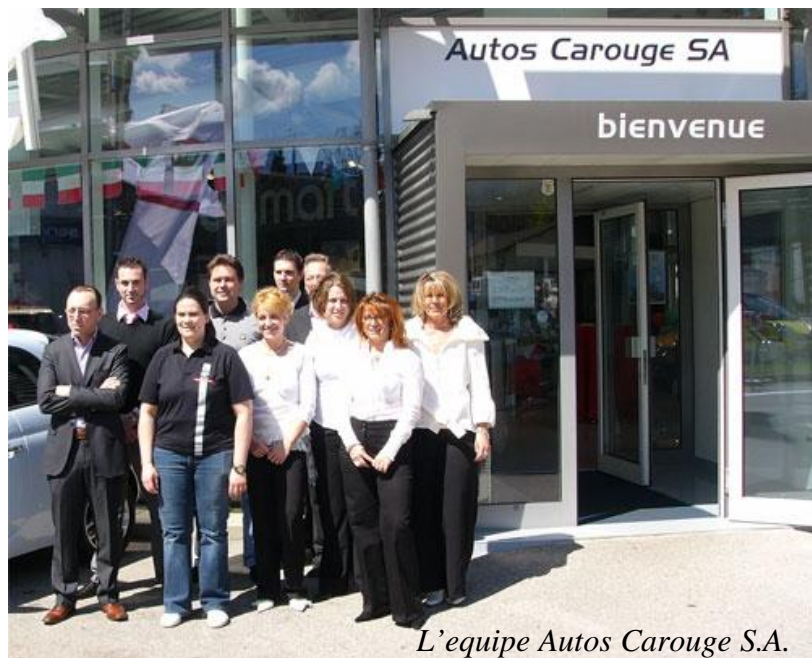
L'equipe Autos Carouge S.A.